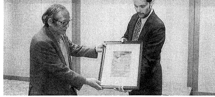
▲セップ氏から日米の納税者運動の交流を祈念して、全米納税者ユニオンから日本のTCフォーラムにワシントンの桜を描いた額縁が送られた。