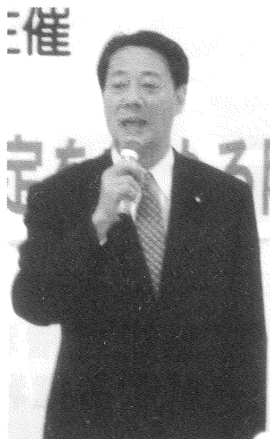
経済財政担当大臣として入閣した海江田万里衆議院議員（TCフォーラムが2010年4月7日に開催した国会内集会で挨拶する海江田万里代議士）。

日弁連は2010年2月18日に「納税者権利保護法（仮称）」要綱案をまとめた。菅改造内閣がスタートし、その中心にいる仙谷由人氏、古川元久氏、それに経済財政担当大臣として入閣した海江田万里氏は、この日弁連の提言した「納税者権利保護法」の方向で法案作成に入るものと予想される。政府税調の下に置かれている専門家委員会及び納税環境整備小委員会も、委員の中に制定には消極的な者もいるが、全体としては新たに「納税者権利保護法」を制定する方向を示すものと思われる。